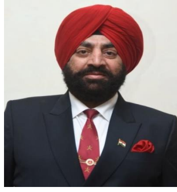
ले. जनरल गुरमीत सिंह मननीय: राज्यपाल: