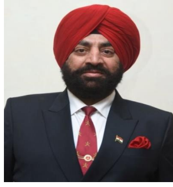
ले. जनरल गुरमीत सिंह माननीय: राज्यपाल: