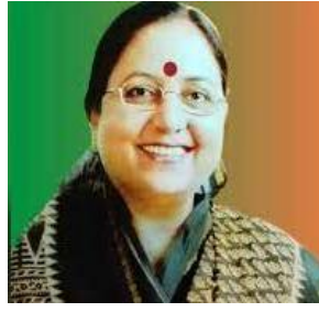
श्रीमती बेबी रानी मौर्य मा. राज्यपाल: