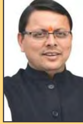
श्रीपुष्करसिंहधामी मा0 मुख्यमंत्री