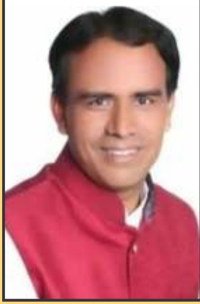
डॉ. धनसिंहरावतः मा. संस्कृतशिक्षामन्त्री