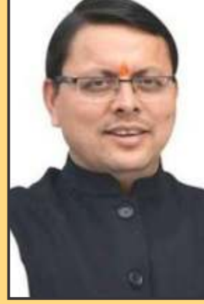
श्रीपुष्करसिंहधामी मा0 मुख्यमंत्री