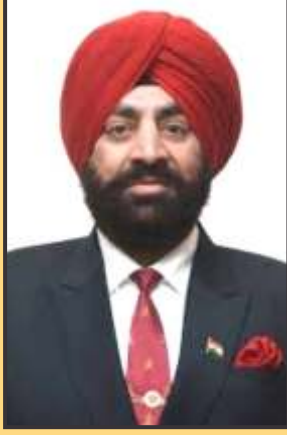
श्रीमन्तो ले. जनरल (से.नि.) गुरमीतसिंहमहोदयाः माननीयाः कुलाधिपतयः उत्तराखण्डप्रदेशस्य राज्यपालाश्च