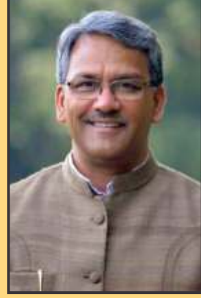
श्रीत्रिवेन्द्रसिंहरावतः मा० मुख्यमंत्री