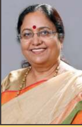
श्रीमतीबेबीरानी मौर्य मा० राज्यपालः